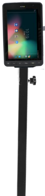
平板可以上下转动