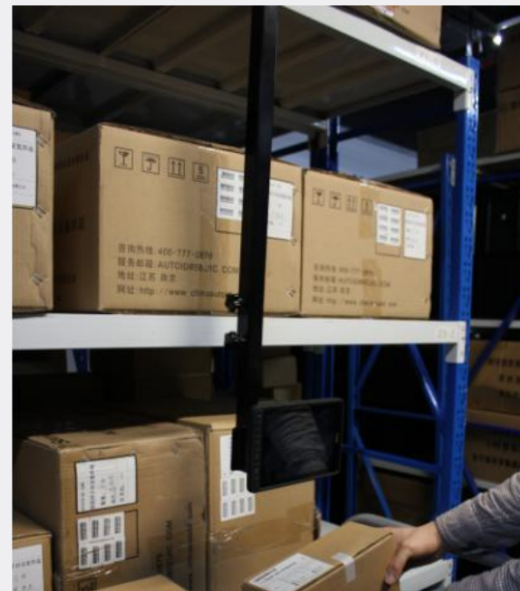
平板可以左右转动