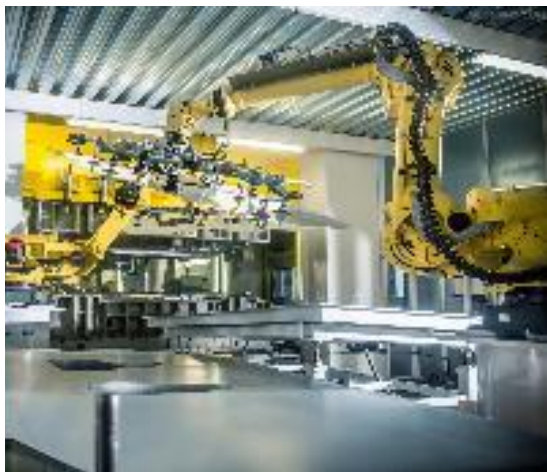
生产制造行业应用