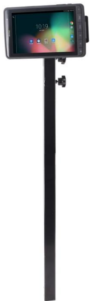
支架长度可以根据实际的 使用需求自由调整